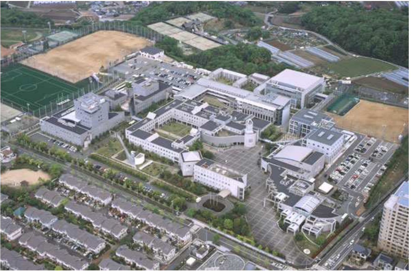
•大学航空写真(2009年4月撮影)