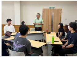
まちづくり会社の磐井社長からのご挨拶