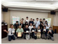
地元のまちなか会の経営者の皆さんとの全体写真