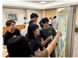
プレゼンに向けて情報整理をするゼミ生