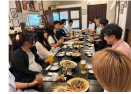
本音が聞けるまちなか会の皆さんとの親睦会

本活動を通じて、学生はSNSを活用した情報収集や購買行動の特徴を整理し、地域商業に対する具体的な提案を行う経験を得た。また、経営者との対話を通じて、情報発信の難しさや顧客獲得の工夫について実感的に理解した。さらに、被災者の話から復興の現実や人とのつながりの重要性を学び、教室では得られない実践的かつ多面的な学びを深めることができた。