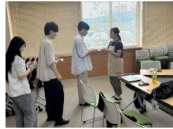
まずは名刺交換。人となりを知ってもらう。

本プロジェクトは、東日本大震災の被災地陸前高田市の復興の支援を目的に、流通科学大学長坂ゼミが岩手県陸前高田市において実施したゼミ合宿を通じ、地元事業者の皆さんとの意見交換や調査活動を通じて、復興の一助とするために行ったものである。毎年テーマを変えて支援を展開している。