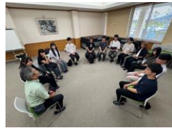
車座のフラットな関係で意見交換

陸前高田市の中心市街地の賑わいを支えるまちなか会のメンバーから、「津波被災市街地の生き残りのための方策をともに探る」と題したワークショップを、流通科学大学の学生と開催したいとの要望があった。具体的には「若者目線の店選び」をテーマとした車座形式の意見交換会を実施し、SNS活用や購買行動について学生の視点を共有するとともに、学生からの提案もさせていただいた。また、津波の被災体験の語り、持続可能なまちづくりに向けた来街者アンケート調査の準備を通じ、地域課題の理解と実践的な学びの機会を得ることができた。