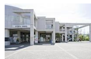
RYUKA DINING (レストラン) (16)