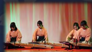
啓明学院中学校・高等学校 伝統文化部