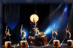
太鼓楽団 大地の会