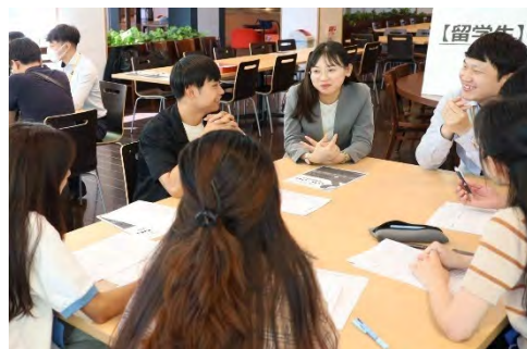
<交流会のイメージ>

https://www.umds.ac.jp/overseas-student/employment-promotion/