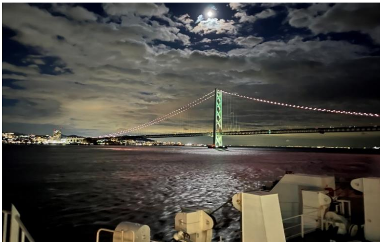
さんふらわあから船上からの風景(フィールドワーク)