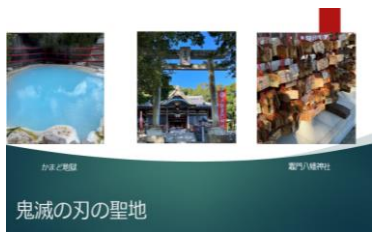
最終プレゼン資料

今年のI-1グランプリのメインテーマは「若者向けカジュアルクルーズの提案」。このメインテーマの下、5つのサブテーマの中から各チームで取り組むテーマを決定しました。本ゼミのチームが選んだサブテーマは、「フェリー到着地での若者向け弾丸フェリーのモデルプランづくり」(フェリー)および「さんふらわあ船内での新サービスおよび船内イベント提案」でした。