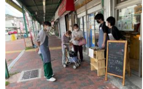
経営面でも様々なチャレンジ。コミュニケーションを取ることの重要性を肌で感じました。

地域の課題は、①神戸市兵庫区平野地区は、過去には市電の終点として繁栄した地域ですが、現在は高齢化により空き店舗が目立つなど、商店街の衰退が厳しく、新しいお店がなかなか出店しない状況です。また、②地域の高齢化が進み、若者が地域の存在に気づいてくれないことも課題でした。学生の課題は、①コロナ禍で、社会との活動が制約されていたので、挑戦する機会がありませんでした。加えて、②挑戦する機会がないので、ゼミ生の目標である社会人基礎力を養成する機会がありませんでした。