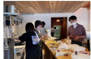
計画段階の狂いが当日の売上にも大きく影響します(仕込みの風景)。

①地域の課題を知ることで、どのようにすれば地域の課題解決に貢献できるかを考え抜くことを目標としました。そのうえで、②学生が同地区に新たに整備された空き店舗を賃借し、カフェ空間への出店を通じて、平野地区にない新たな価値を見出すことを目的としました。