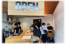
店内の風景。事前告知が功を奏してお客さまもたくさん来てくれました。