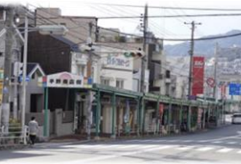
平野商店街は、決して人通りが多い地域ではありません。現場で活動することで始めて気づく課題も数多くありました。

神戸市兵庫区平野地区は過去には市電の終点として栄えた地域ですが、現在は高齢化の進展などにより空き店舗が目立っています。本プロジェクトは、学生が同地区に新たに整備された空き店舗を改修したカフェ空間への出店体験を通じて、社会人基礎力を養成するとともに、平野地区にない新たな価値を見出すことで、地域貢献を果たそうとする取り組みです。また、賑わっているとは言えない「課題先進地」で社会共創活動をすることで、社会と共創を実現することの難しさを理解することも目標としました。