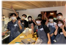
出店前の風景。目標を達成し、かつ地域に貢献できるかどうか。