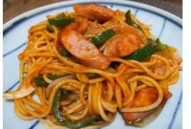
パスタチームは3種類のパスタを用意。写真は具材たっぷりのナポリタン。