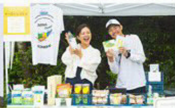
おきのえらぶ島物産展