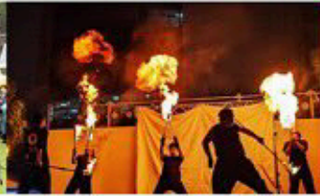
Fire himawari ~向火葵~ [collaboration]