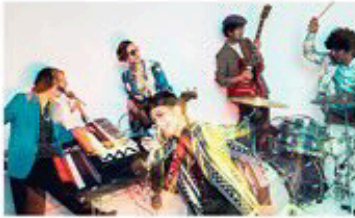
サーカスフォーカス