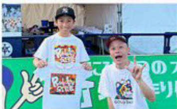
FUN THINGS KYOTO 世界を愛するプリントワークショップ