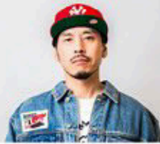
RYO the SKYWALKER [Special collaboration]