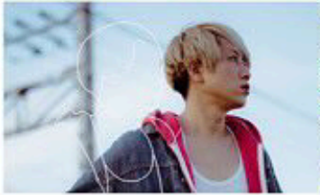
キャラメルパッキング タロオ