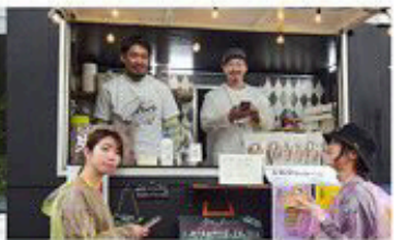
キッチンカー (多数出店)