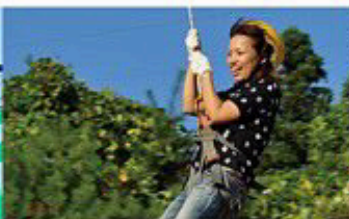
ジップライン (ソラカケル)