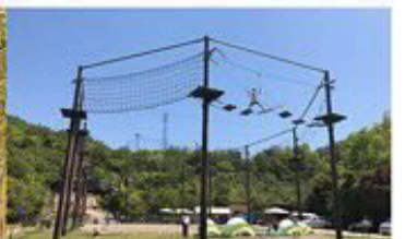
天空×大冒険 ソラカケル