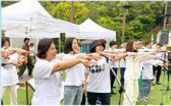
Noodle peeps [collaboration]