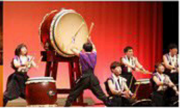
流通科学大学 和太鼓部