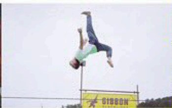
GIBBON [スラックラインチーム]