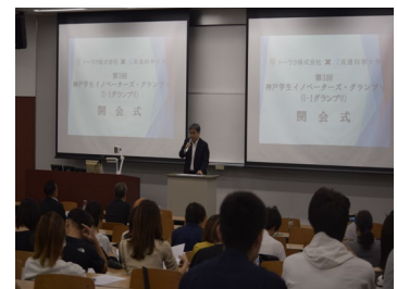
<昨年度の開会式の様子>