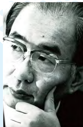
流通科学大学 創設者 中内 功

「豊かで持続可能な食」をテーマとして全国の高校生が取り組んでいる取り組みを、本講演会でご紹介いたします。新しいビジネスのヒントや、高等学校での探求学習の参考例となれば幸いです。